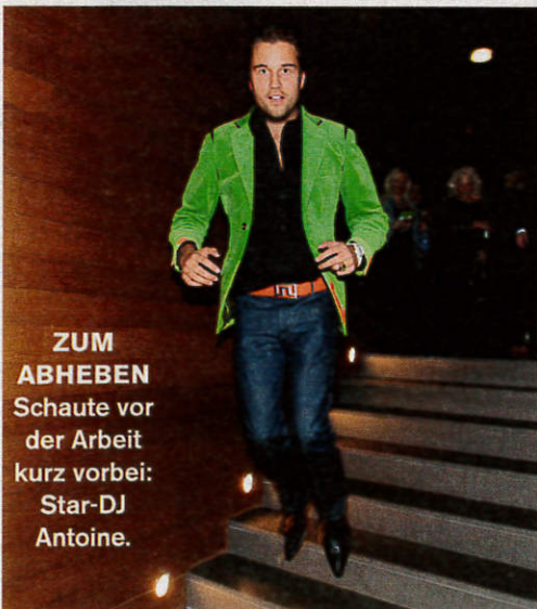
ZUM ABHEBEN Schaute vor der Arbeit kurz vorbei: Star-DJ Antoine.